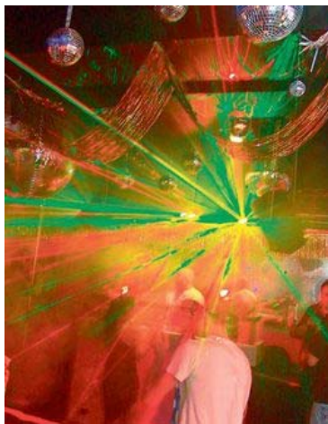
Ottomanische Verführungstänze unter Discokugeln: Das Stairs in Altstetten.

Das Stairs beim Letzipark in Altstetten ist der letzte After-Hour-Club Zürichs – und ein Rückzugsort für Menschen, die enorm viel Zuneigung zu verteilen haben.